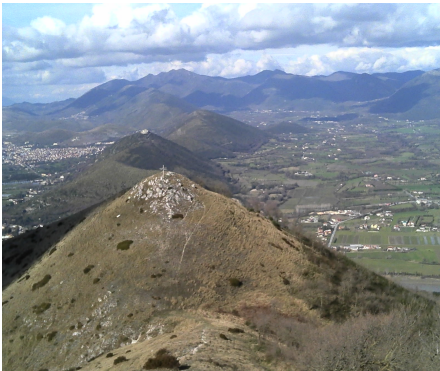
Dal Tifata, oltre verso ....

Alle ore 11:30 , ha inizio la manifestazione di inaugurazione del libro di vetta. Nella radura, adiacente al tabellone, si terranno brevi interventi commemorativi dell'evento, da parte del CAI, delle altre associazioni partecipanti e di chi vorrà. Poi, un gruppo alla volta, accompagnato dal proprio referente CAI, attraversando il boschetto sul retro del tabellone, si porterà sulla cima del Tifata, per testimoniare sul libro di vetta la propria presenza e le motivazioni e sensazioni, che si provano nel salire sulla cima della montagna di casa.