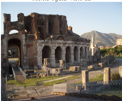
Anfiteatro campano di S. Maria C.V.