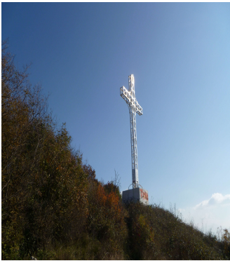
Croce in vetta al Tifata (603 m)

L'energia pulita di Caserta L'energia pulita di Caserta L'energia pulita di Caserta