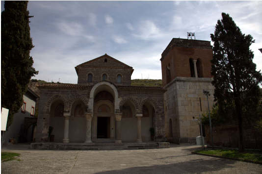
Sant'Angelo in Formis, frazione di Capua