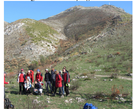
Il Tifata dal pianoro dei "letti garibaldini"