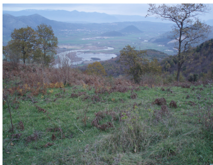
Le anse del Volturno dal crinale del Tifata

Prima di arrivare in cima, ci si ferma nella piccola radura, adiacente ad un grande tabellone, dove ci si incontra con il gruppo proveniente da S. Angelo in Formis. Il tratto è lungo km 2,300 e presenta un dislivello di circa 260 metri; si pensa che si possa raggiungere l'obiettivo: la radura, di cui sopra, alle ore 11:30, dove incontrare il gruppo salito da S. Angelo.