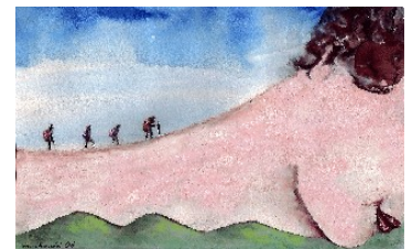
Allungiamoci sui nostri colli