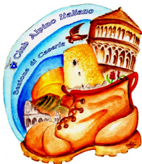
S. Angelo in Formis