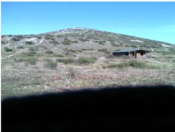
Casupola, sfondo M. Marmolelle

Alle ore 10:00 , i gruppi che si sono incontrati presso la casupola, alla sella tra i monti Sommacco e Marmolelle, proseguono verso quest'ultimo in direzione nord-ovest, fino alla cima del Tifata. Il percorso, un po' duro, ma sempre in cresta, consente ampie vedute verso l'interno (le anse del Fiume Volturno, il Massiccio del Matese, il Massiccio del Taburno-Camposauro ed il Monte Maggiore) e verso il mare (il Vesuvio, i Monti Lattari, Napoli e le isole del golfo, la pianura campana con le sue storiche città, il Monte Petrino, il Monte Massico, i Monti Lattani con il Roccamonfina ed infine gli Aurunci).