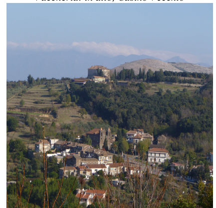
In basso, Chiesa Madonna delle Grazie