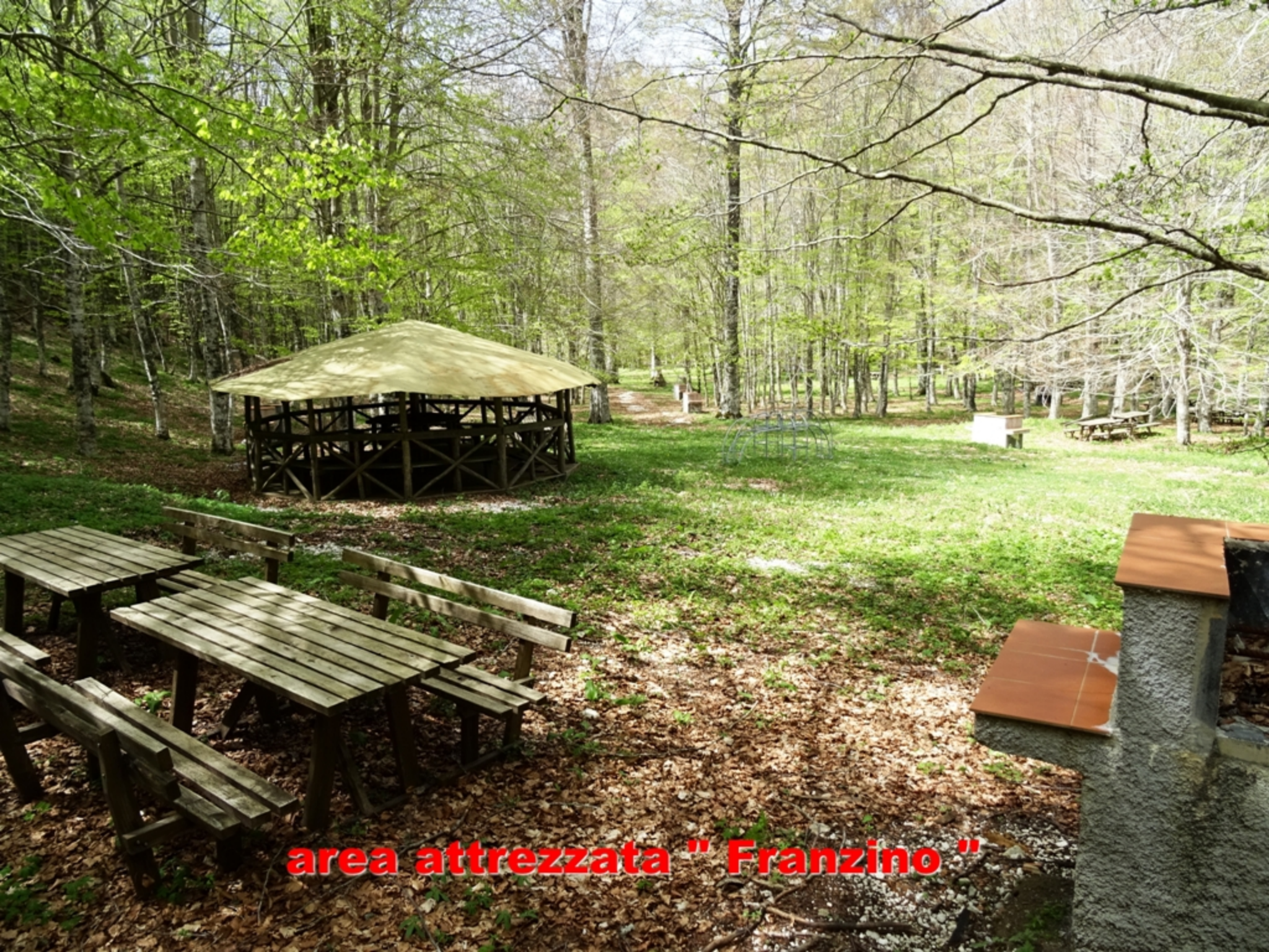
area attrezzata " Franzino "